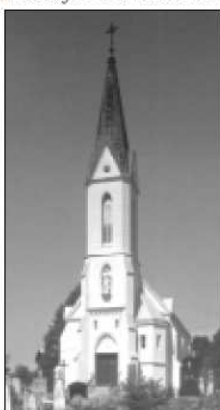
Najbliższy sercu pana Wicemarszałka kościół ewangelicki w Kamienicy.