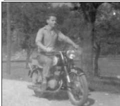
...na motorze SHL (ok. 1961 r.)