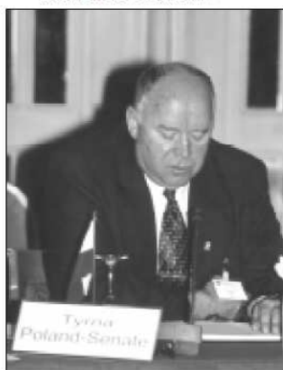
Listopad 2000 - Cypr. Konferencja przewodniczących parlamentów krajów aspirujących do Unii Europejskiej.