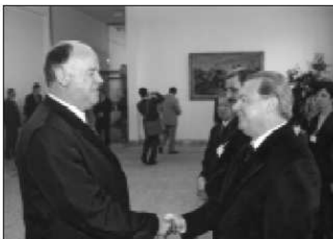
29.05.2001 r. - spotkanie z prezydentem Słowacji Rudolfem Schusterem.