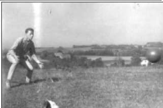
...w czasie gry w piłkę (ok. 1962 r.)