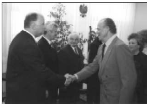
16.05.2001 - spotkanie z królem Hiszpanii Juanem Carlosem.